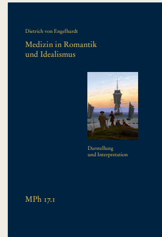
Band 1 Darstellung und Interpretation