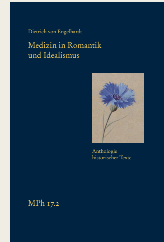
Band 2 Anthologie historischer Texte

XVI, 601 Seiten 2023, Leinen, Fadenheftung, Lesebändchen ISBN 978-3-7728-2951-2, € 98,- bei Gesamtabnahme € 86,-